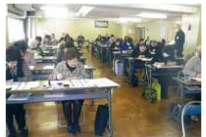
平成二十五年三月十二日の講習会風景