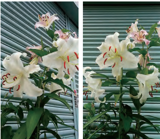
カサブランカ 立派に咲きました