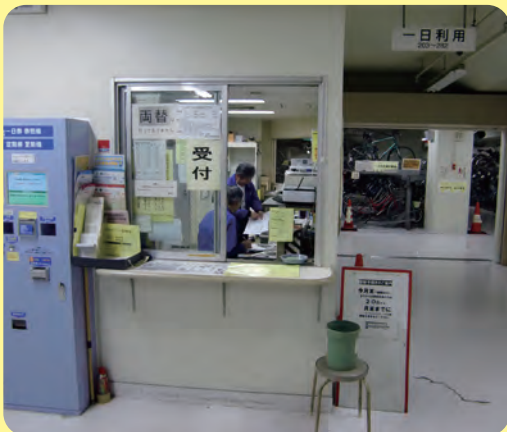
新御徒町駅自転車駐り場